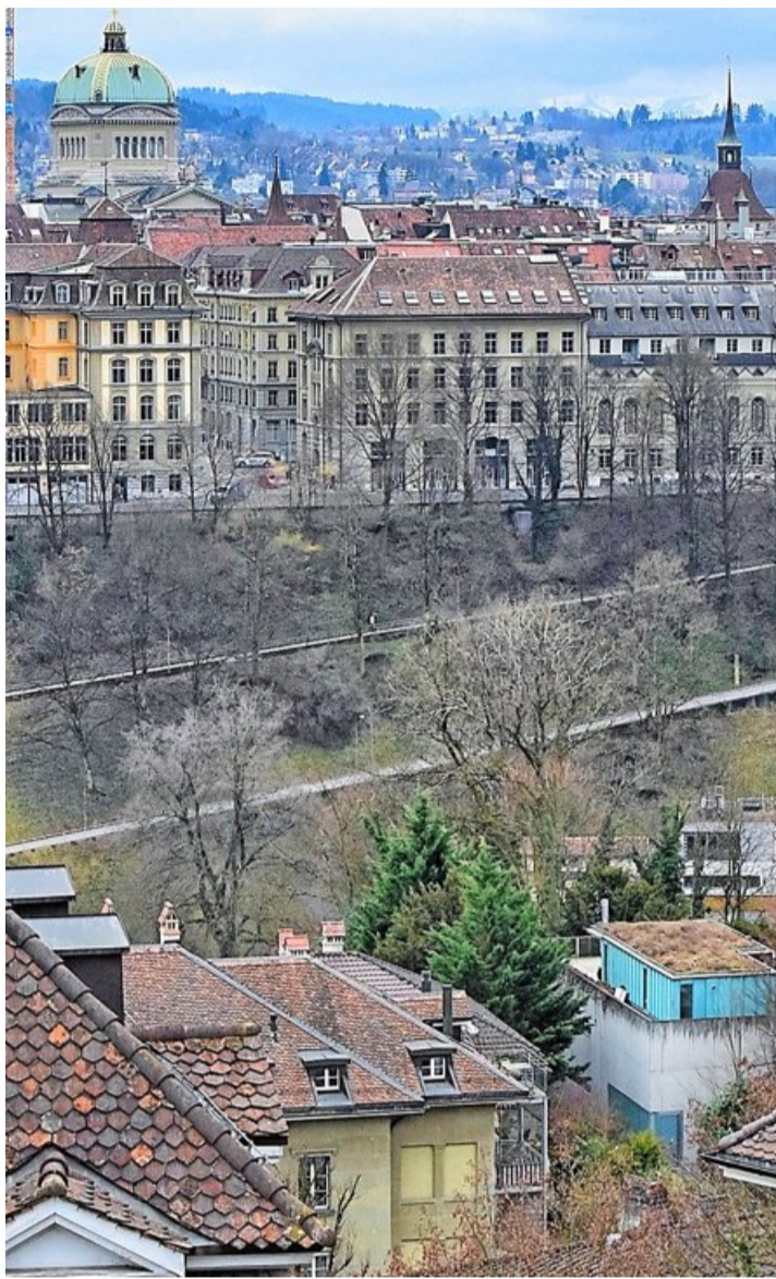
Die Häuser der Anwohner im Vordergrund, das geplante und umstrittene Jugendlokal im Hintergrund (Garagentore auf der Strassenseite).

Die Reitschule war gestern der Punkt, um den sich die Diskussion immer wieder drehte. Eine Anwohnerin etwa hatte ein Déjà-vu-Erlebnis. Genau so Gespräche wie jetzt habe sie mit Ex-Stapi Alexander Tschäppät wegen der Reitschule geführt. Damals habe dieser gesagt, es sei illegal, wenn die Jugendlichen mit mobilen Musikanlagen daherkämen, aber die Stadt könne nichts dagegen machen. «Und jetzt sagt auch ihr uns: Nein, nein, das wird schon nicht passieren.»