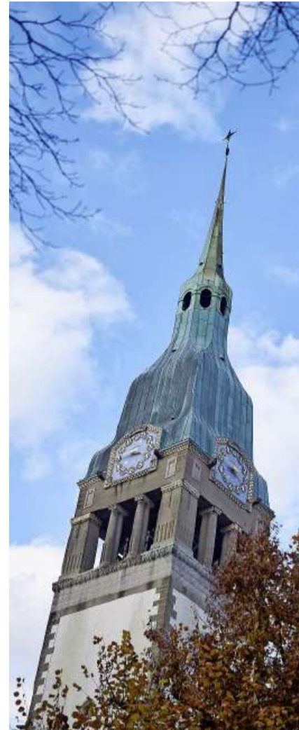
Die Pauluskirche gehörte künftig in den Kirchenkreis 2. Foto: Manu Friederich

Bund-Grafik/Quelle: Reformierte Gesamtkirchengemeinde Bern