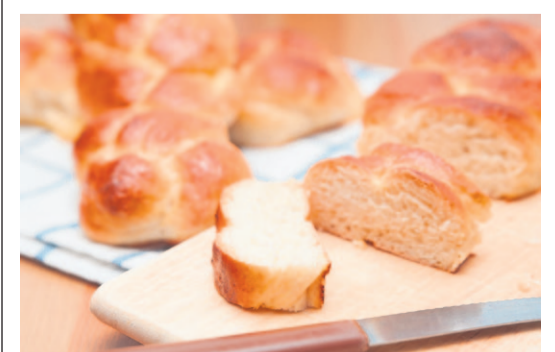
Teilete mit Zöpfe für alle.