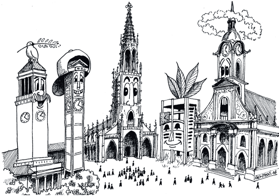
Kirchen-Dialog! (Cartoon: Marco Röss)

Seit den Hearings im Februar und März hat sich im Strukturdialog II viel getan. Fürs Kirchenfest haben der Gesamtpjektausschuss GPA und die Teilprojektausschüsse TPA 1 und TPA 2 zehn zentrale Punkte für eine mögliche zukünftige Kirche vorgeschlagen.